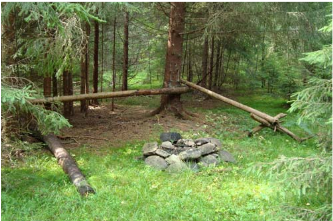
Gjevelsrudbråten er et godt brukt turmål og rekreasjonsområde for beboerne i Ytre Enebakk, noe denne bålplassen på stedet vitner om.