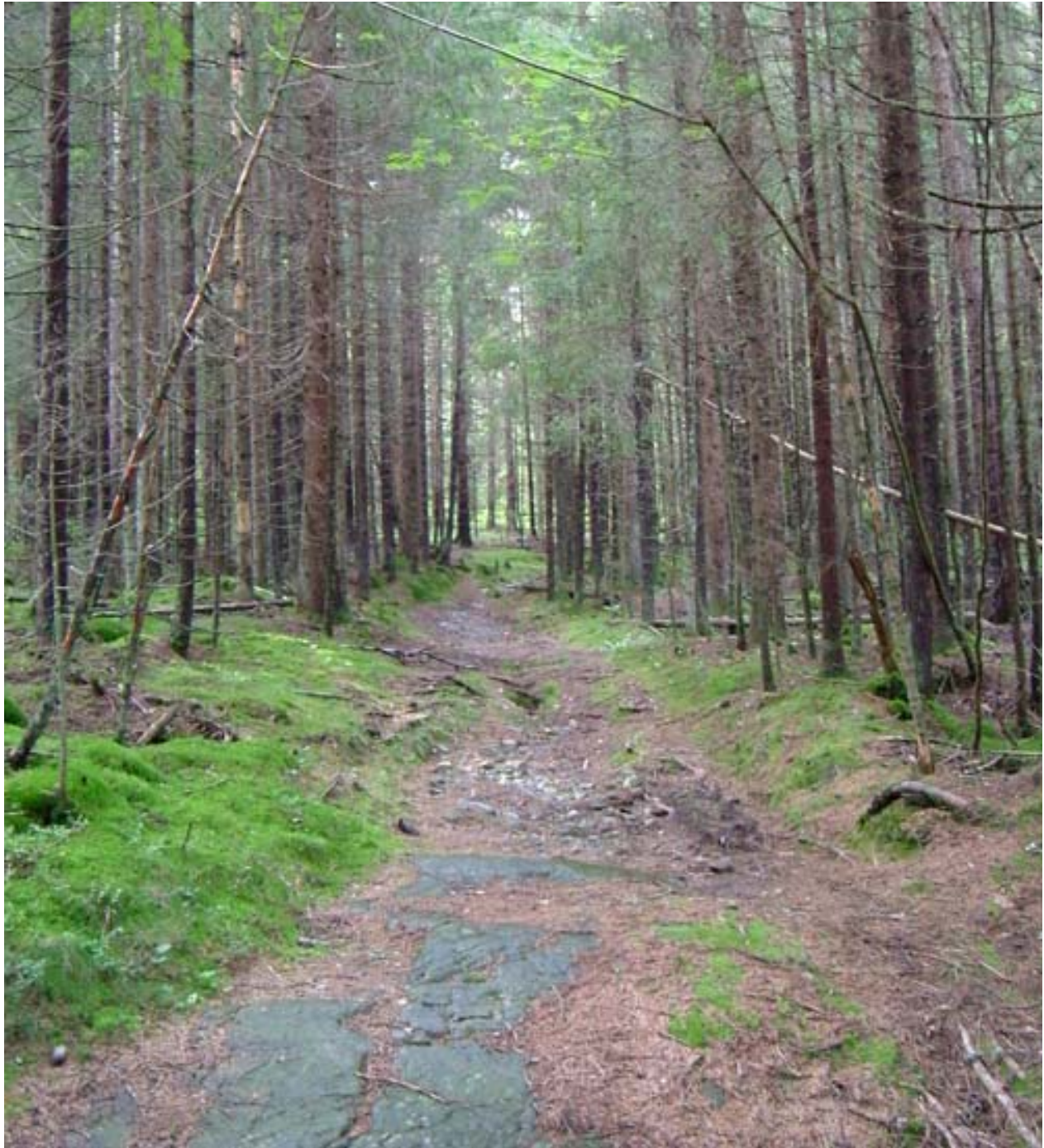
Den gamle veien gjennom BY 20 og By 21 er et unikt kulturminne.

Veien startet ved Enebakk kirke og gikk via Krona, Støttum, Holstad, Nyland, Solberg, Bjerke og Korsveien. Derfra gikk den inn forbi Gjevelsrud, Haugen, plassen Gjevelsrudbråtan og inn i utbyggingsområdet. Videre ned igjen til Nylende og Våg, opp til Kvernstua, Bjerkland og innover mot hovedstaden. Dersom denne veien har sin opprinnelse fra før reformasjonen (1537), er den et automatisk fredet kulturminne ( Jmfr. lov om kulturminner, kapittel 2, § 4 : Automatisk fredete kulturminner. Følgende kulturminner fra oldtid og middelalder (inntil år 1537) er fredet: Vegfar av alle slag med eller uten brolegging av stein, tre eller annet materiale, demninger, broer, vadested, havneanlegg og åreskifter, båtstøer og båtoppbygg, fergeleier og båtdrag eller rester av slike, seilsperringer, vegmerker og seilmerker. )