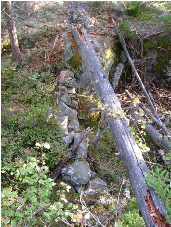
Rester etter en steinsetting som kan være en dyregrav.