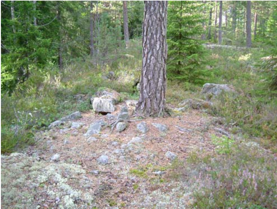
Er dette restene av en gravrøys? Eller er det et kast?

I tillegg til overnevnte har vi lokalisert noe som kan være en dyregrav like utenfor utbygningsområdet, samt noe som kan være en gravrøys eller et kast. Begge disse funnene må undersøkes nærmere.