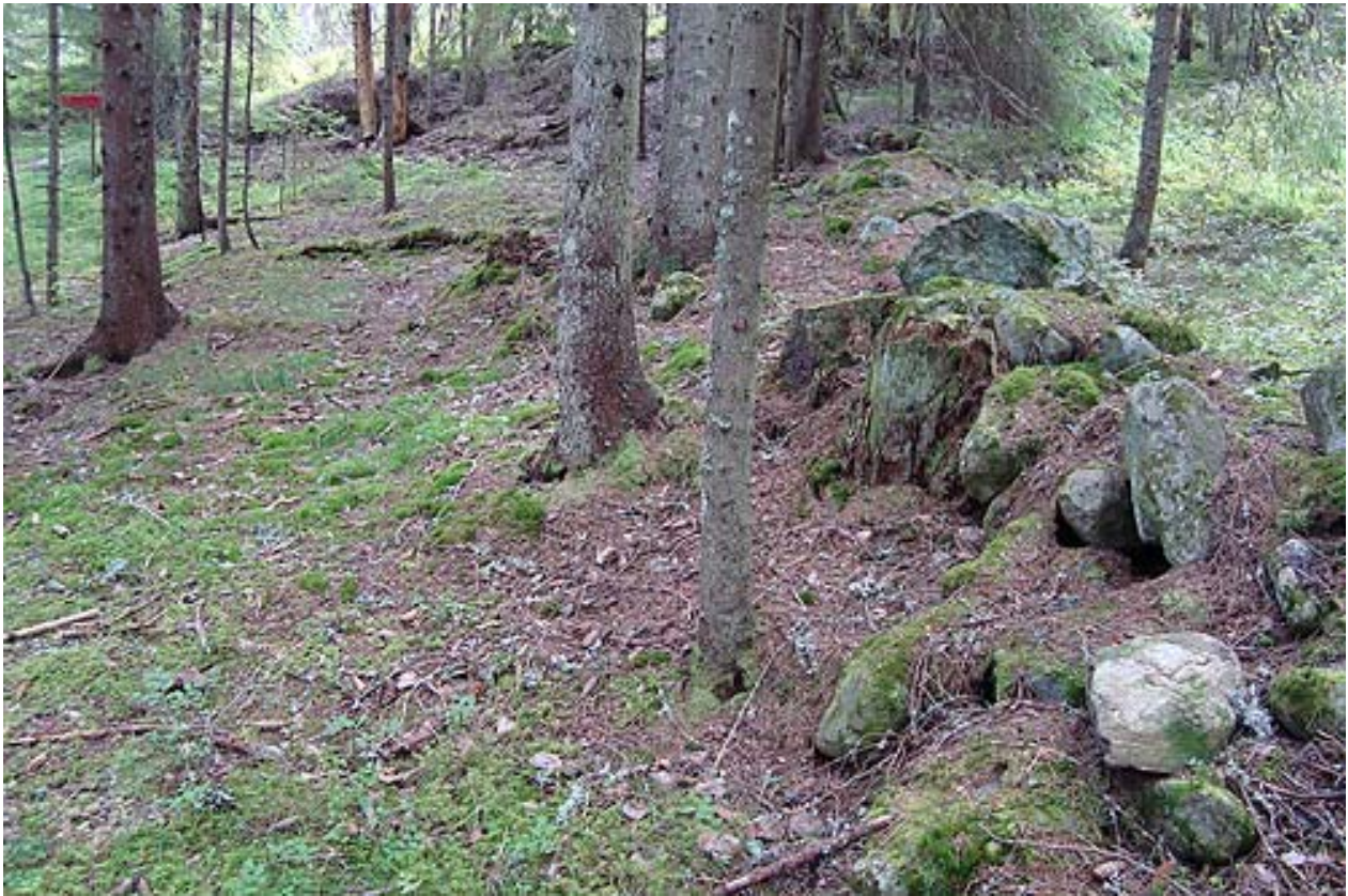
Fra husmannsplassen Norli.

Like ved Norli, ligger Bernhardplassen .