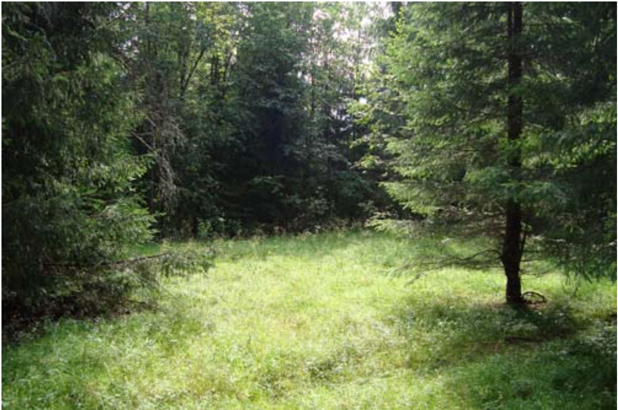
Fra tunet på Gjevelsrudbråten.