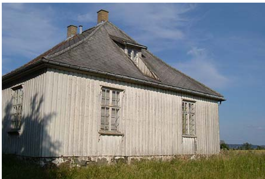
Auen på Flateby.